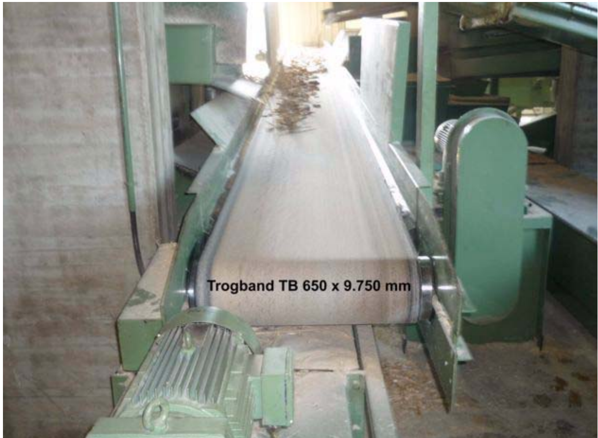
Trogband TB 650 x 9.750 mm