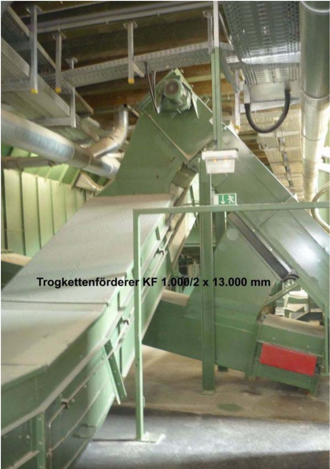
Trogkettenförderer KF 1.000/2 x 13.000 mm