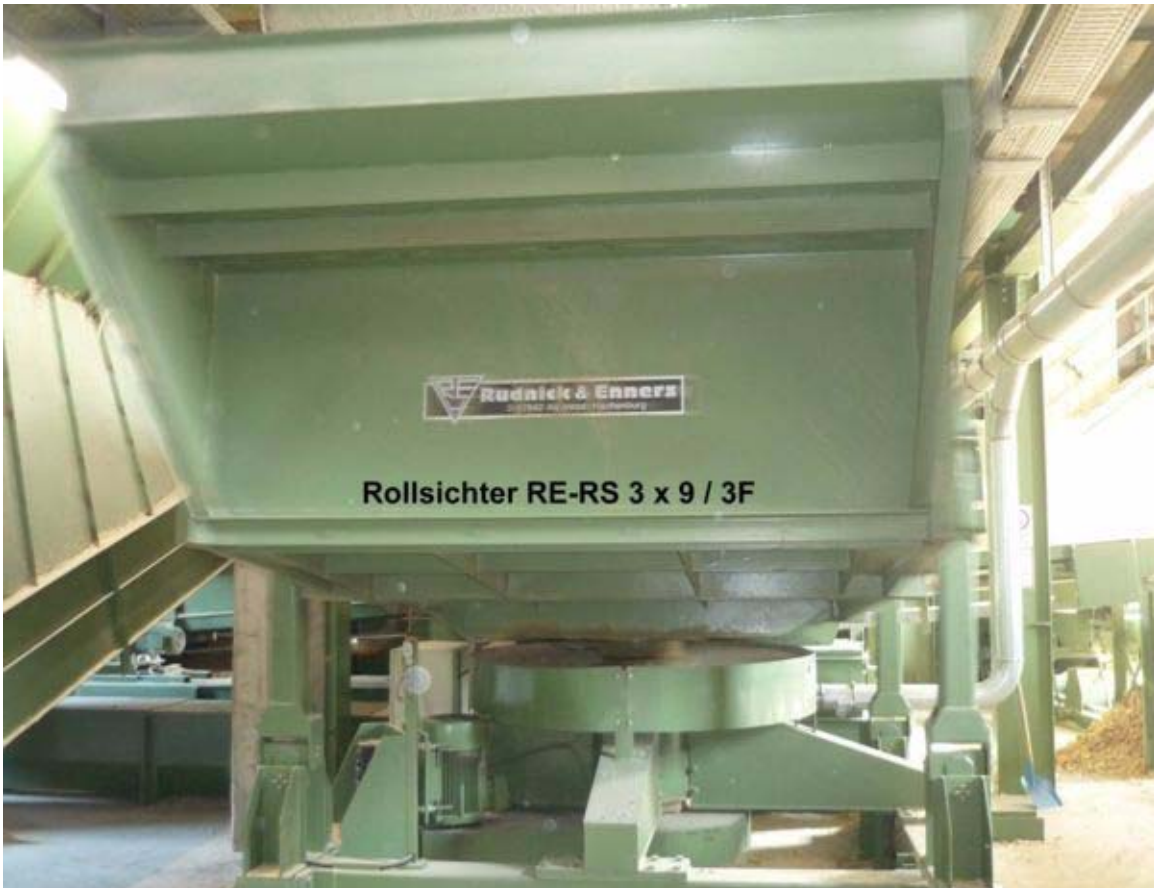
Rollsichter RE-RS 3 x 9 / 3F