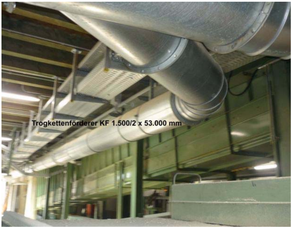
Trogkettenförderer KF 1.500/2 x 53.000 mm