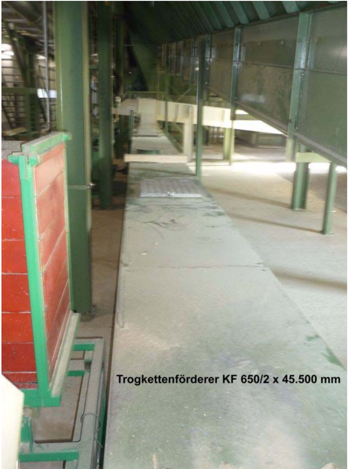
Trogkettenförderer KF 650/2 x 45.500 mm