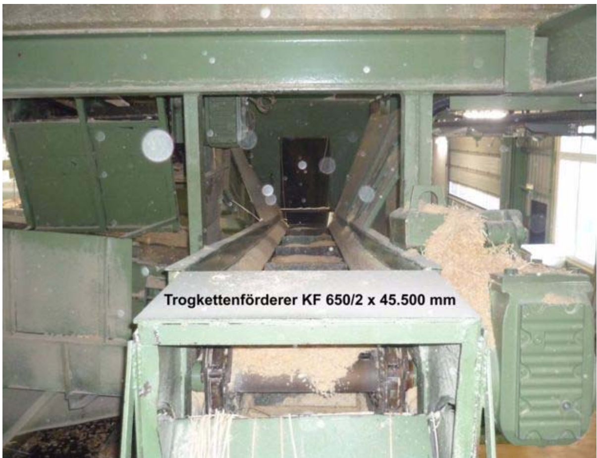
Trogkettenförderer KF 650/2 x 45.500 mm