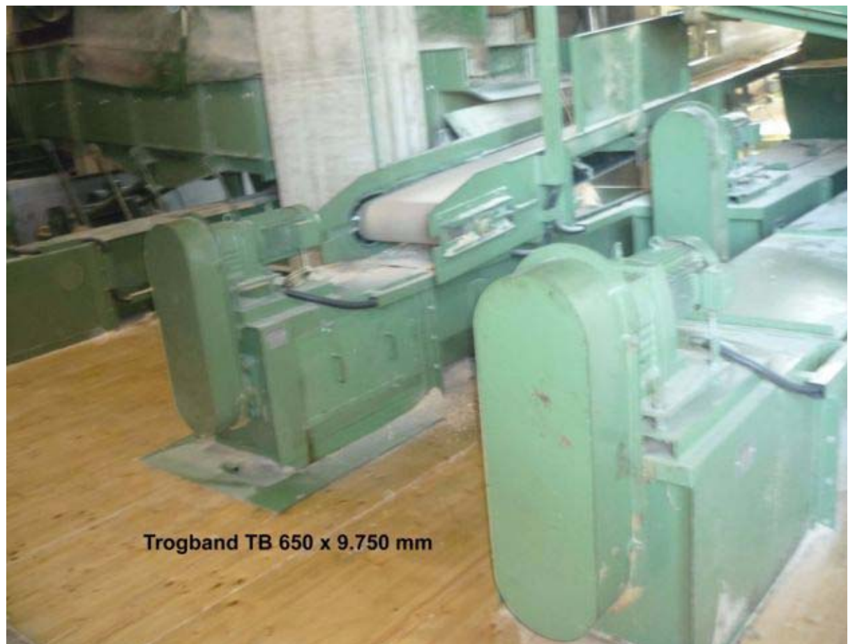
Trogband TB 650 x 9.750 mm