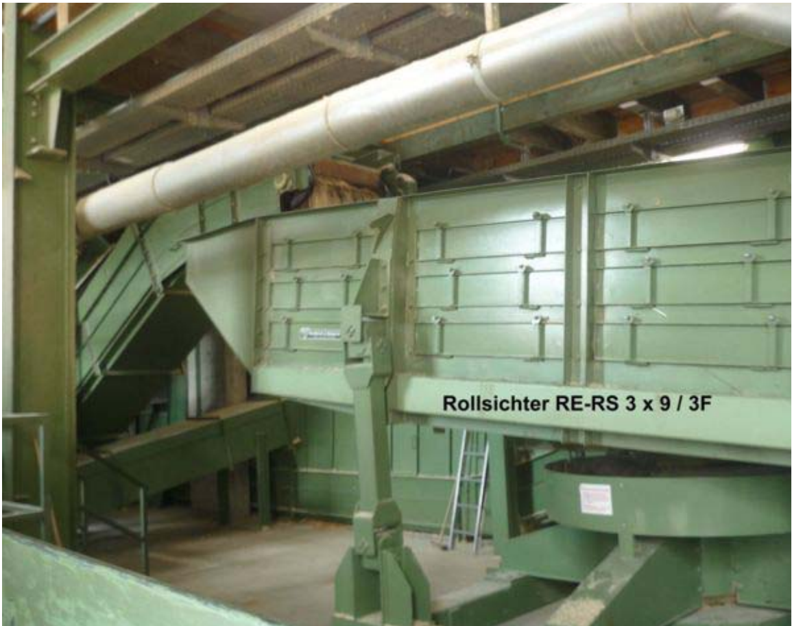
Rollsichter RE-RS 3 x 9 / 3F