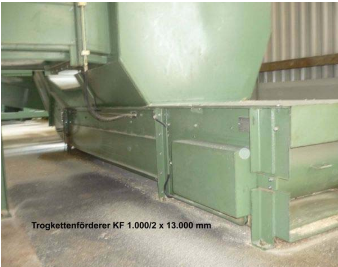
Trogekettentransporterer KF 1.000/2 x 13.000 mm