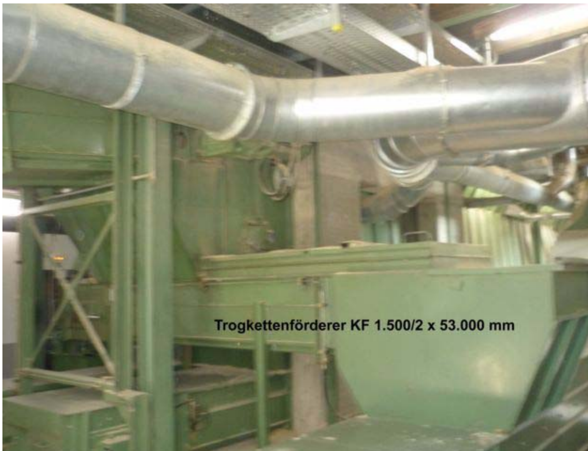
Trogkettenförderer KF 1.500/2 x 53.000 mm