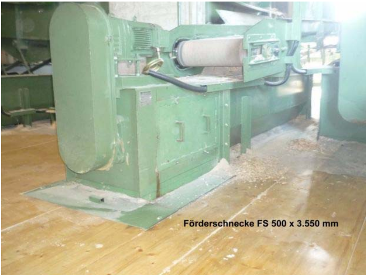
Förderschnecke FS 500 x 3.550 mm