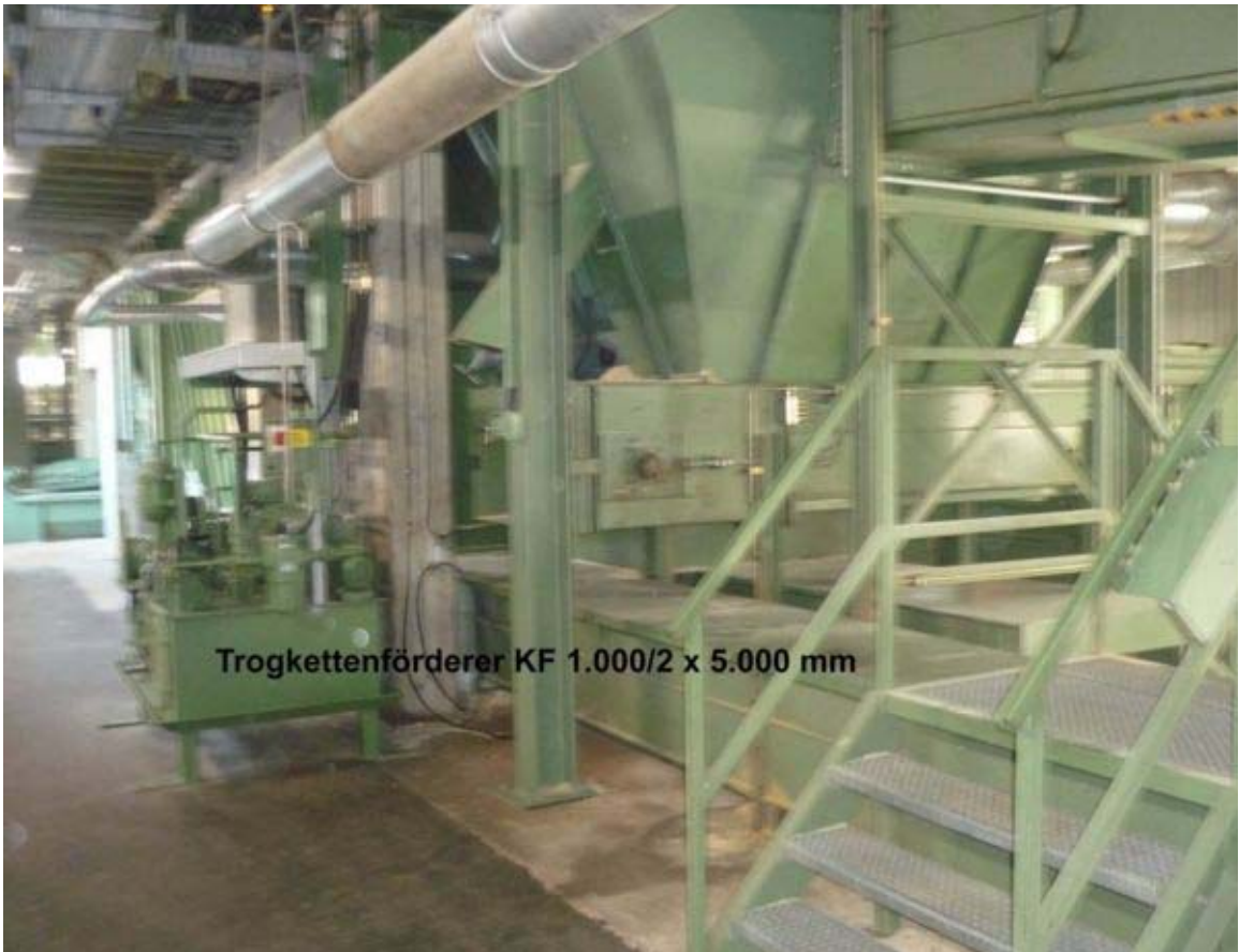
Trogekettentransporterer KF 1.000/2 x 5.000 mm