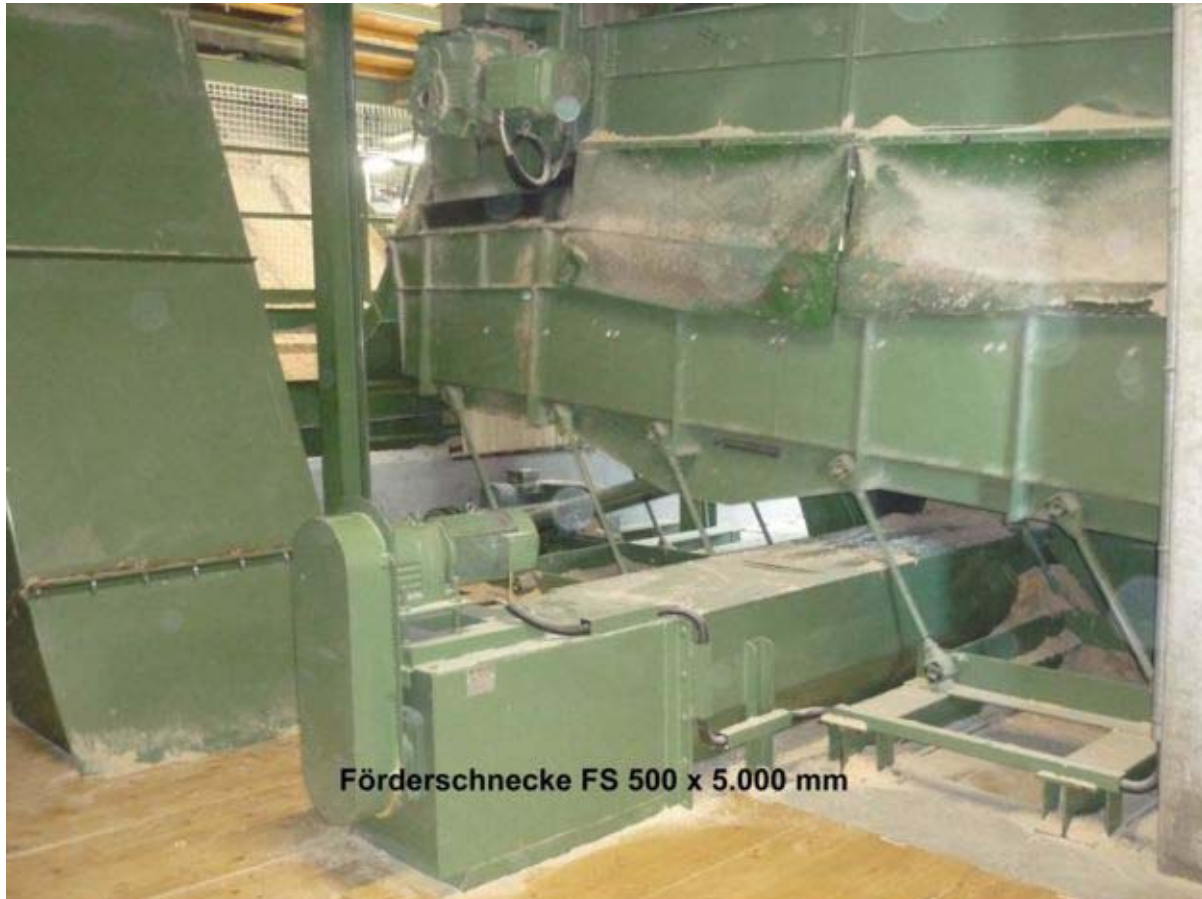
Förderschnecke FS 500 x 5.000 mm