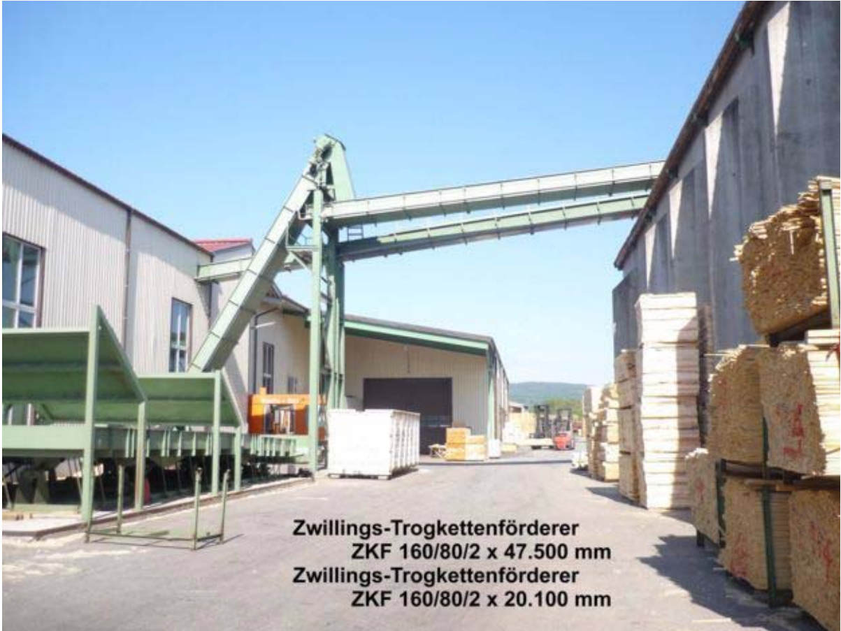
Zwillings-Trogkettenförderer ZKF 160/80/2 x 47.500 mm Zwillings-Trogkettenförderer ZKF 160/80/2 x 20.100 mm