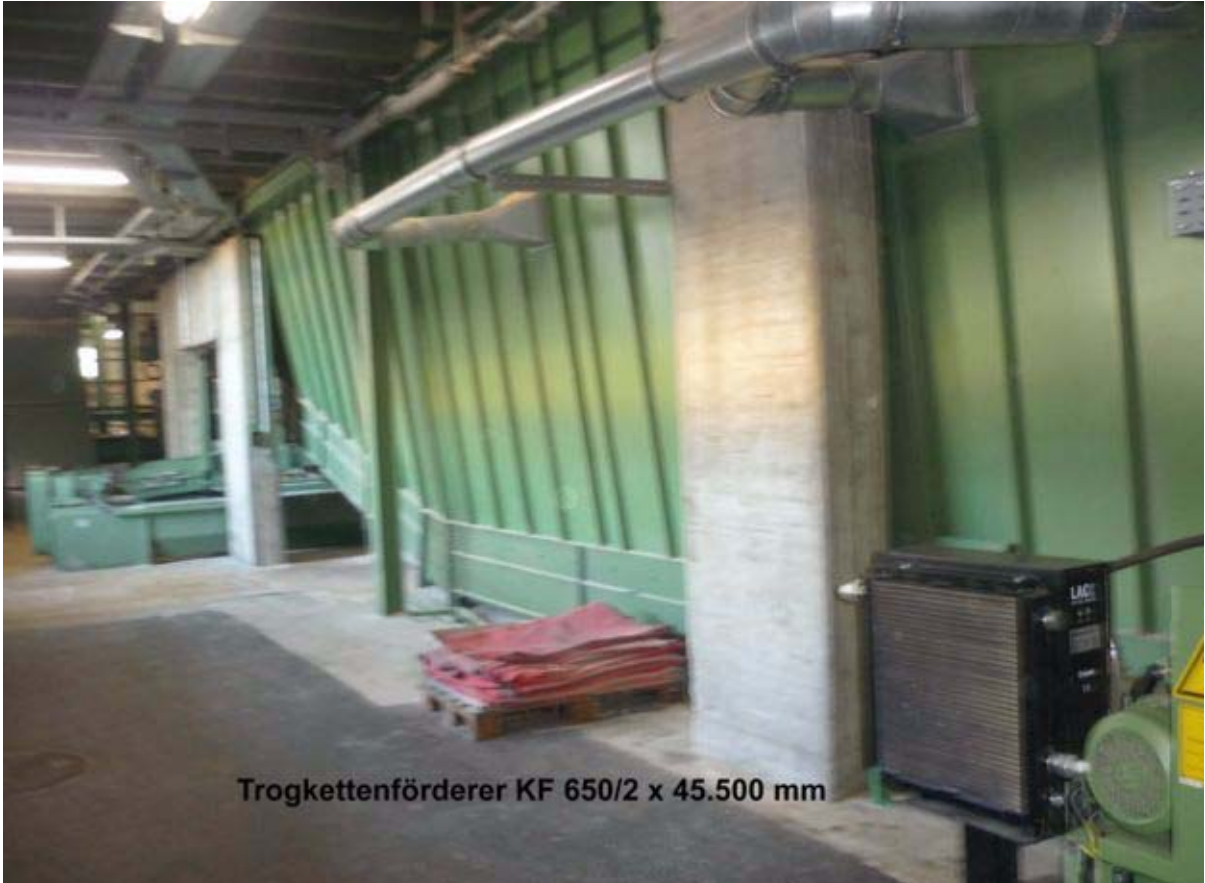
Trogkettenförderer KF 650/2 x 45.500 mm